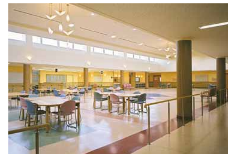
▲ダイニング（認知症専門棟）