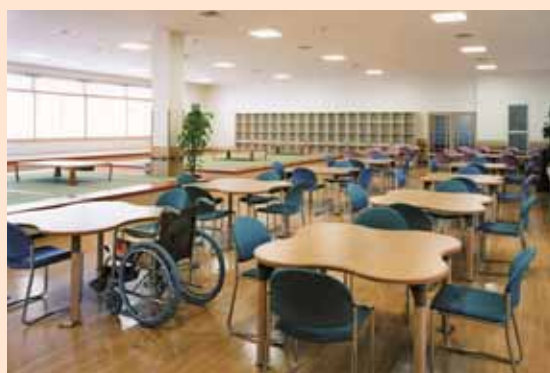
▲通所者デイルーム