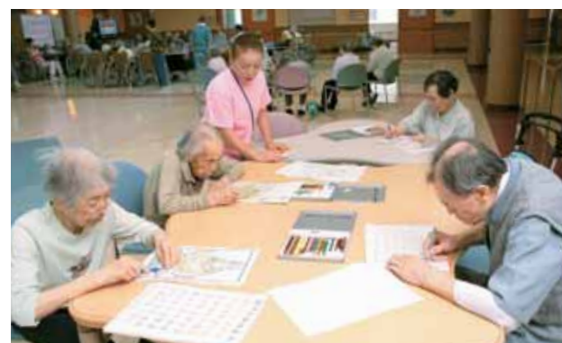
▲レクリエーション