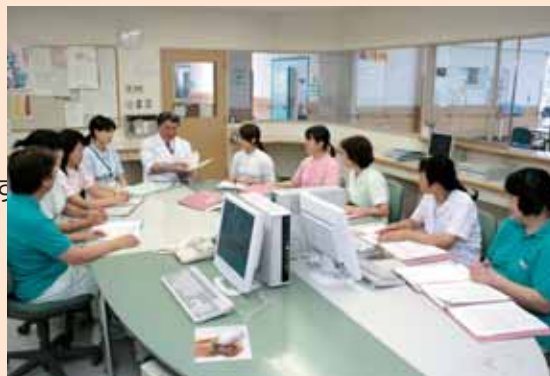
▲カンファレンス風景

医師、看護師、介護職員、支援相談員、理学療法士、 作業療法士、歯科衛生士、管理栄養士、薬剤師、 介護支援専門員 等