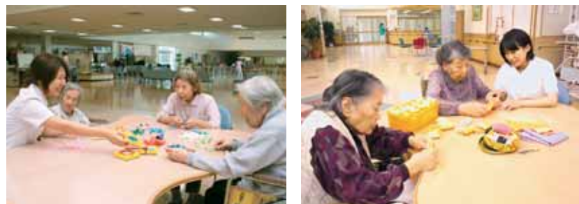
趣味を通してのリハビリテーション